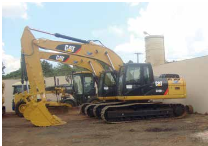
Novas escavadeiras e carregadeiras chegaram à sede da empresa recentemente: prontas para ir às obras.