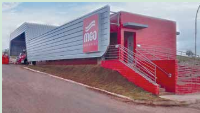
Nova instalação do Serviço de Atendimento ao Usuário (SAU) da MGO Rodovias oferece diversos serviços aos usuários da BR-050

SAUs, elas são acionadas por sistema de rádio pelo Centro de Controle Operacional da MGO para atender rapidamente usuários em situação de emergência na rodovia. (Com informações da área de Comunicação da MGO Rodovias) ▽